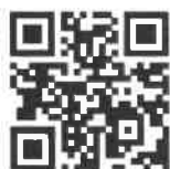
線上報名系統 QR Code